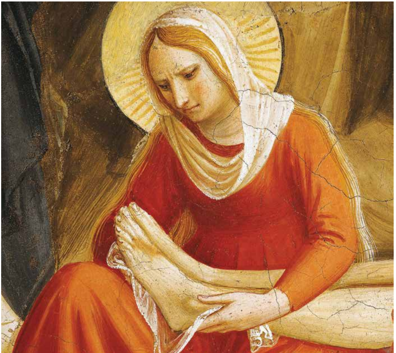
La Lamentation du Christ.