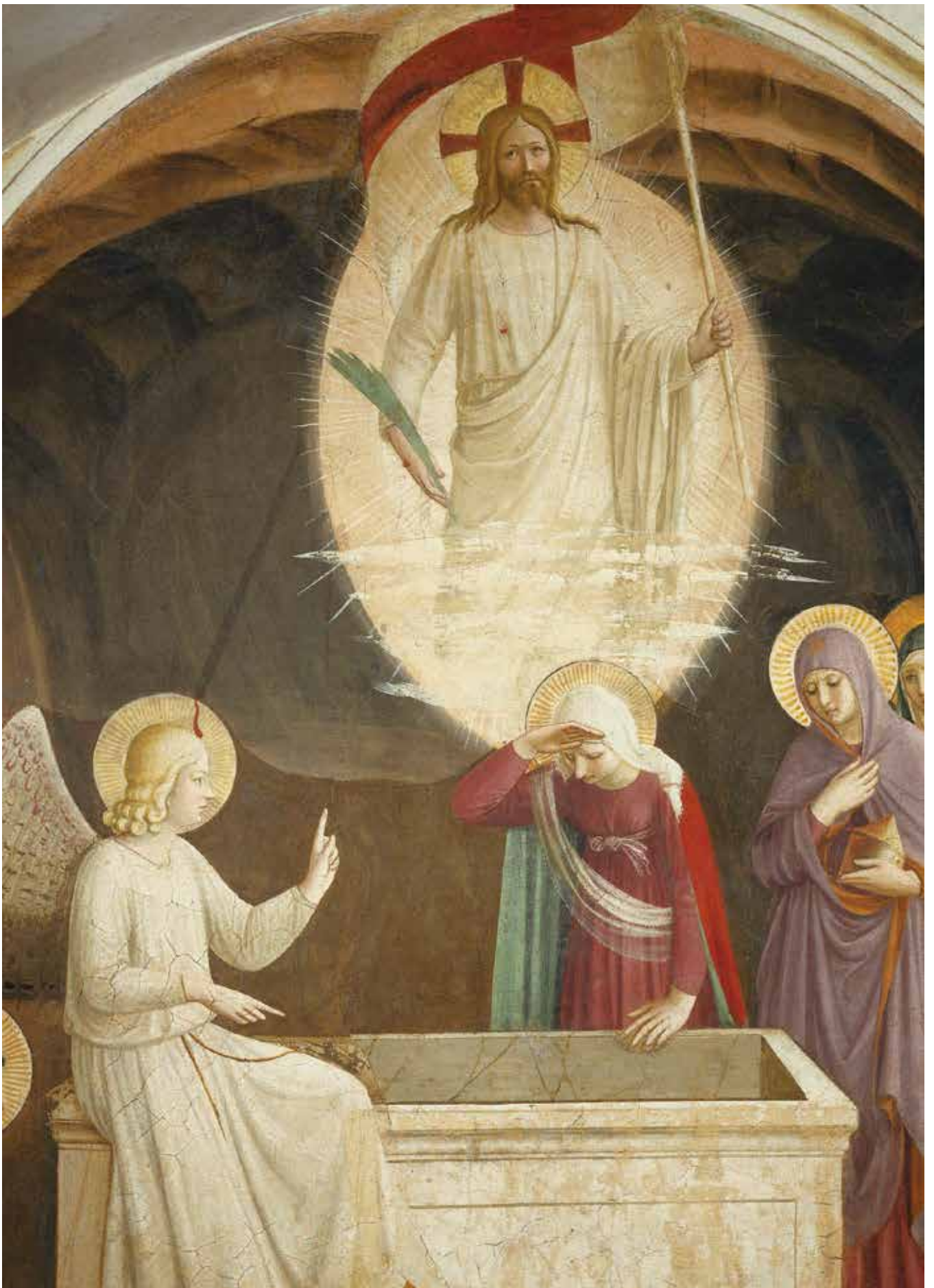
La Résurrection (détail).