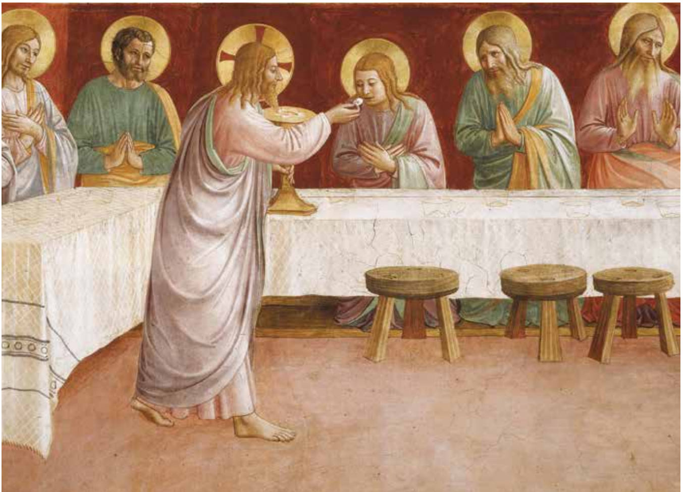
L'Institution de l'Eucharistie.