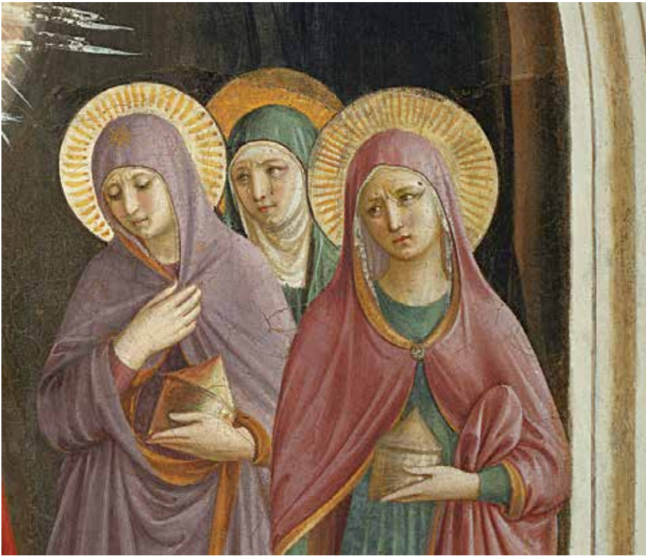
Les saintes femmes au tombeau.

» cette conception de notre personne – qui est ainsi uniquement parce qu’il y a Quelqu’un qui répète notre nom, autrement nous serions en train de nous lamenter sur notre existence – cette conception n’est pas une abstraction, c’est une expérience avant d’être une conception ; et c’est justement pour cela qu’elle fait émerger une autoconscience de nous-mêmes, semblable à celle qui est née en Marie Madeleine qui n’a plus pu se regarder comme avant parce qu’elle était toute déterminée par ce « Marie ! »