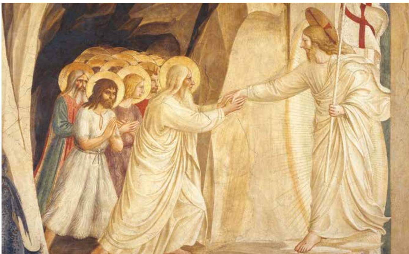
La Descente aux enfers.