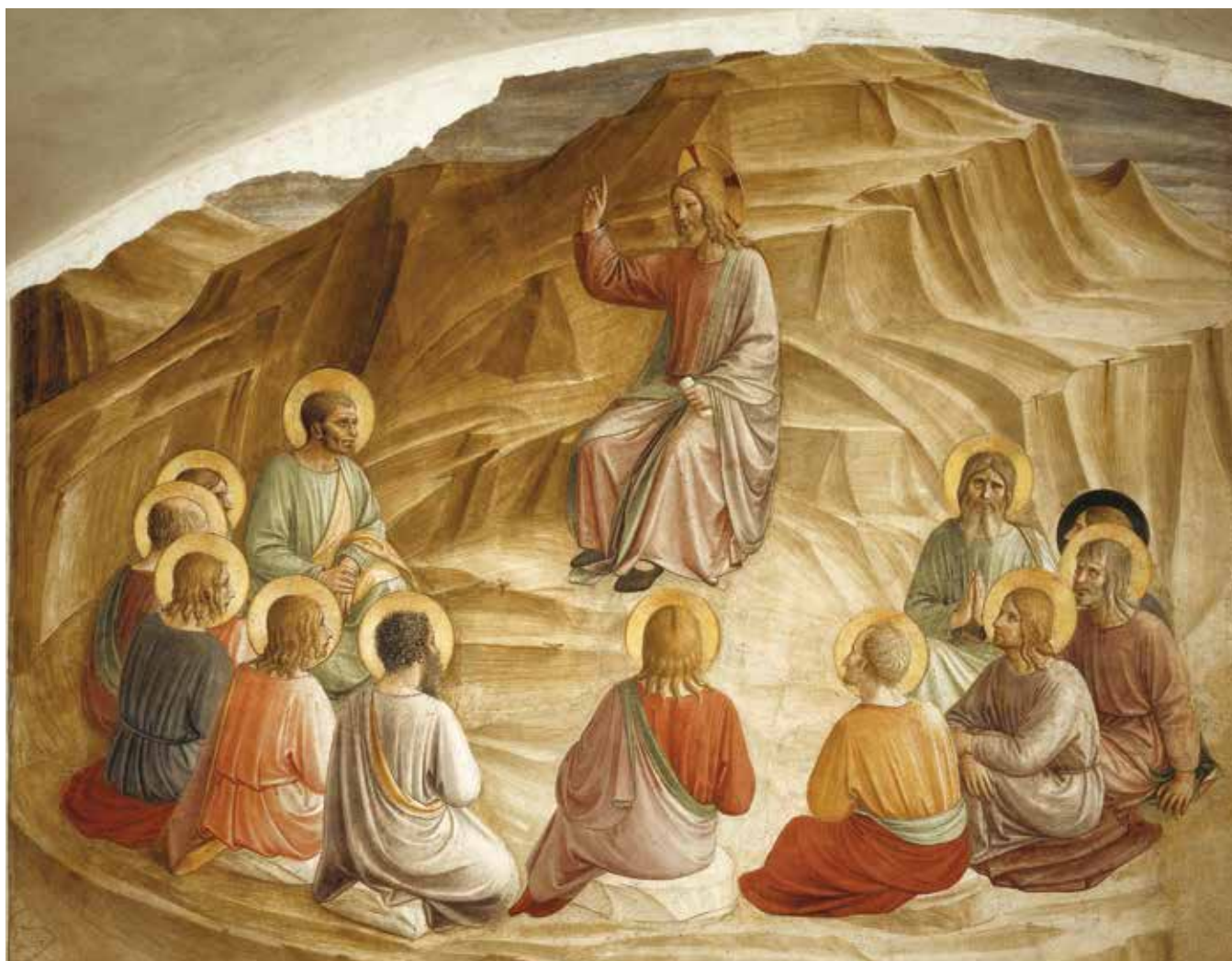
Le Sermon sur la montagne.

toujours vers l'avant. Je cite encore une fois le pape François : « Il résulte alors clairement que la foi n'est pas intransigeante, mais elle grandit dans une cohabitation qui respecte l'autre. Le croyant n'est pas arrogant ; au contraire, la vérité le rend humble, sachant que ce n'est pas lui qui la possède, mais c'est elle qui l'embrasse et le possède. Loin de le raidir, la sécurité de la foi le met en route et rend possible le témoignage et le dialogue avec tous » ( Lumen fidei , n. 34).